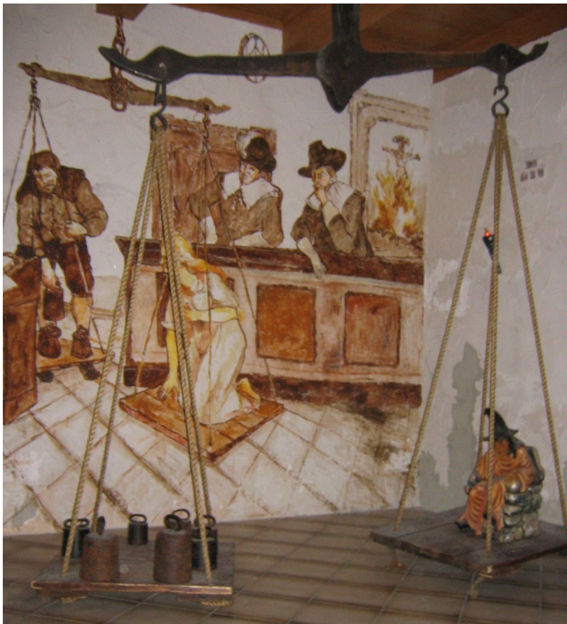
De waagproef (Wikipedia)

De heks kon vrijgepleit worden van hekserij door het ondergaan van de sleutel-, de water- en de waagproef of andere folterpraktijken waaraan zij werd blootgesteld en waaraan zij in de meeste gevallen ook bezweek. Werd zij schuldig geacht, dan wachtte haar een verschrikkelijke dood: de brandstapel, wurging, onthoofding, ... een gebeurtenis waar nogal wat lieden enthousiast naar kwamen kijken.