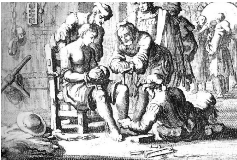
Het Nieuwsblad (4/10/2016)

De laatste zogenaamde heks in Vlaanderen werd in 1684 terechtgesteld in Belsele; Martha van Wetteren uit Landegem, die levend verbrand werd.