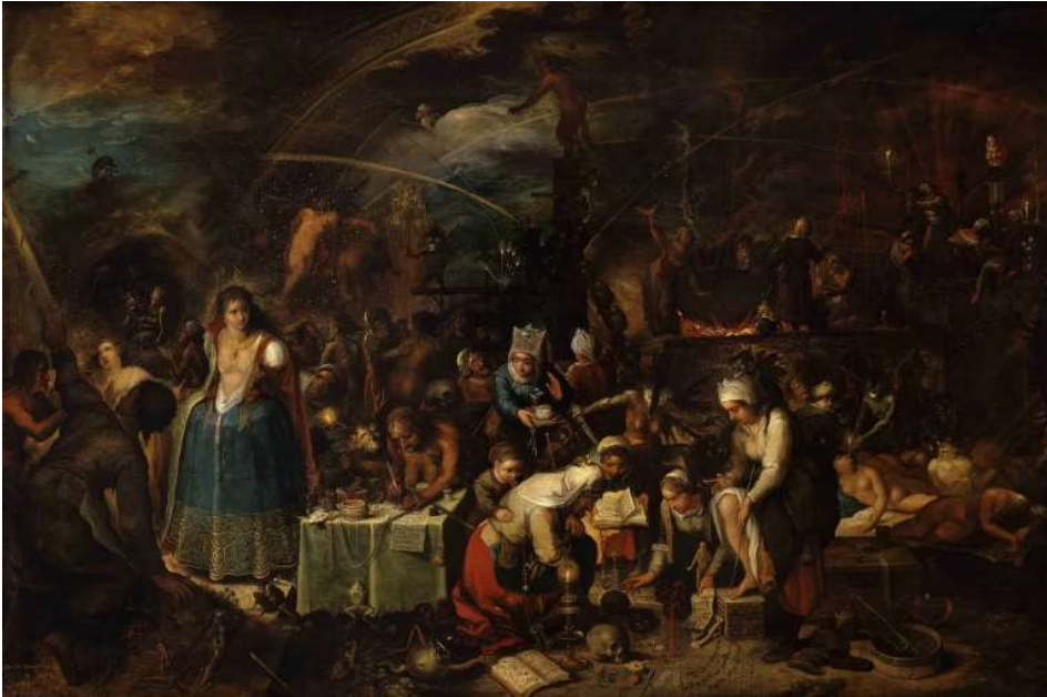
Heksenbijeenkomst Frans Francken 1607