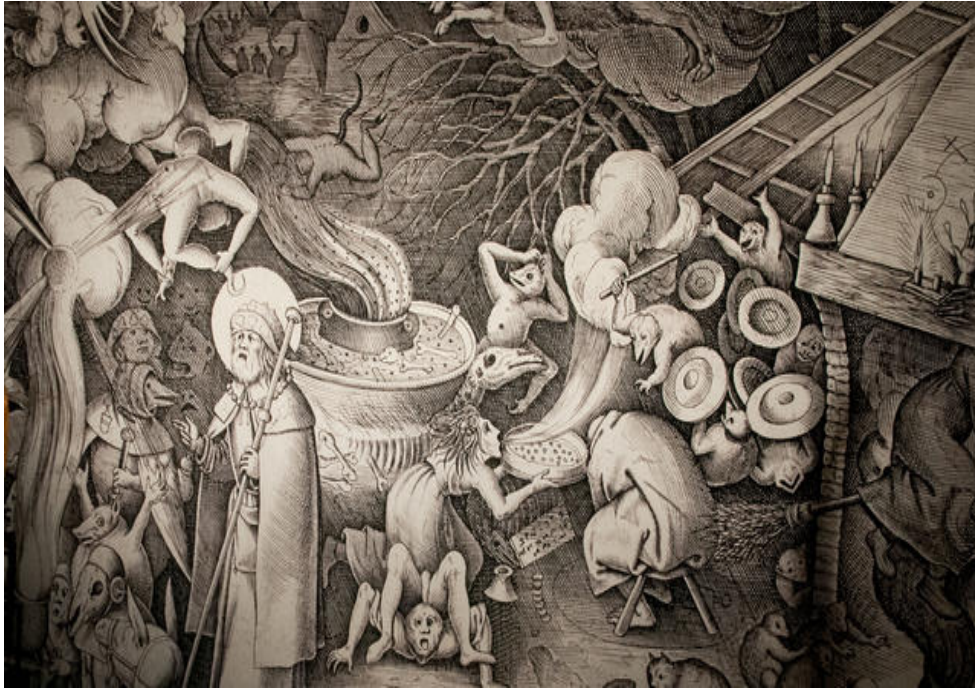
Sint Jacob bij de tovenaars Pieter Bruegel (Wikipedia)