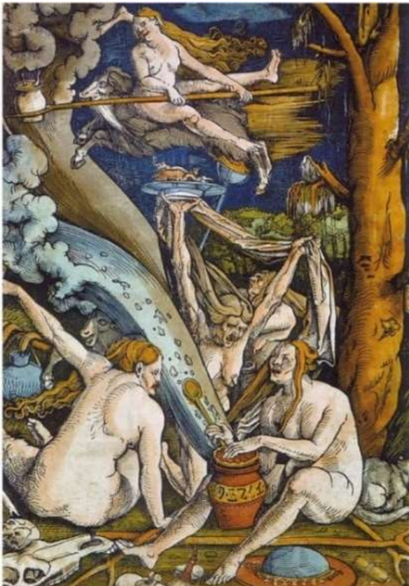
Spotprent van Hans Baldung Grien 1508